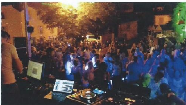
Bal du 13 juillet