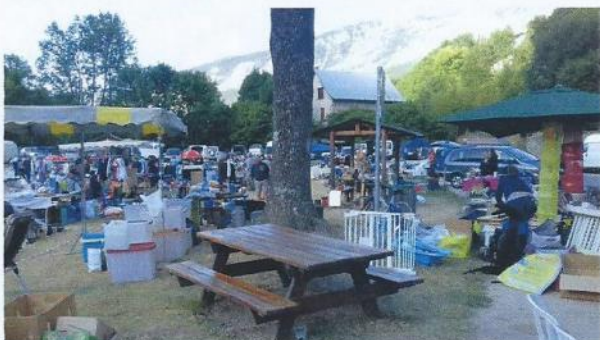
Foire à la brocante

la première lettre de l'année sert généralement à remercier les membres de l'A.S.T.L.C.B. Je ne vais donc pas déroger à cette règle. Un grand merci à tous mes compagnons bénévoles sans qui les manifestations ne pourraient se faire :