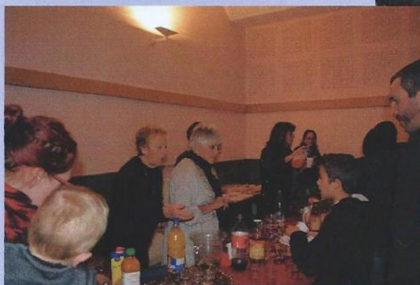
Noël des enfants de la commune